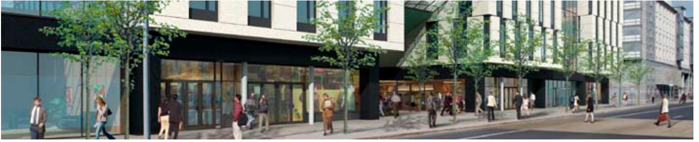
An Institiúid Eolaíochtaí Bitheleighis nua i gColáiste na Tríonóide.

Tá campas Choláiste na Tríonóide i mBaile Átha Cliath lonnaithe i gcoirlár na cathrach. Ar na háiseanna nua-aimseartha den scoth atá suite ar champas 47 acra de chlóis cloch duirleoige, d'árais stairiúla agus de pháirceanna glasa imeartha, tá an tIonad Spóirt, an tÁiléar Eolaíochta, ionad taighde Naineolaíochta, Mol an tSeomra Fhada agus an Institiúid Eolaíochtaí Bitheleighis nua.