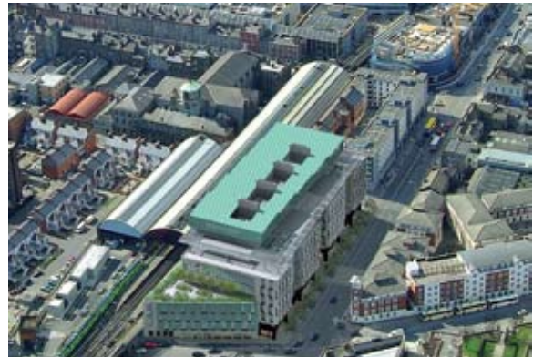
Forbairt Eolaíochtaí Bitheacha

Tá an Fhorbairt Eolaíochtaí Bitheacha ar an tionscadal tógála is uailmhianáí i stair na Tríonóide. Seo suíomh idir Sráid Cumberland agus Sráid Sandwith, a úsáideadh roimhe seo mar charrchlós dromchla, agus táthar á athfhorbairt chun forbairt mheasta a dhéanamh de spás acadúil agus tráchtála de bhreis is 30,000 méadar cearnach.