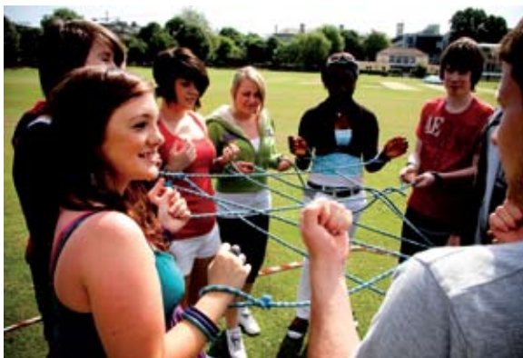
Mic léinn iar-bhunskoile ag glacadh páirte i Scoil Samhraidh TAP 2009

Is réimse tionscnamh iad Cláir Rochtana na Tríonóide (TAP) atá dírithe ar an ráta rannpháirtíochta ag oideachas trú leibhéal a mhéadú i measc daoine fásta óga agus mic léinn lánfhásta ó ghrúpaí socheacnamaíochta faoi ghannionadaíocht. Bunaíodh na cláir mar chuid de straitéis fhoriomlán chun dul i ngleic leis na rátaí ísle de mhic léinn ó ghrúpaí socheacnamaíochta áirithe a théann ar aghaidh chuig oideachas trú leibhéal agus cuireann siad in iúl go bhfuil an Coláiste ag baint amach a mhisean sóisialta.