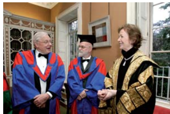
An Siorra David Attenborough agus Terry Pratchett, beirt ar bhronn Seansailéir na hOllscoile, Mary Robinson Céimeanna Oinigh orthu sa bhliain 2008