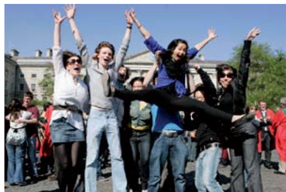
Mic léinn ón Scoil Leighis ag ceiliúradh na Scoláireachtaí bronnadh orthu ar Luan na Tríonóide 2009

Tuigtear le fada an lá gur éacht acadúil thar na bearta iad Scoláireachtaí Fhondúireacht na Tríonóide agus Scoláireachtaí eile. Déanann mic léinn céime, ag deireadh an dara bliain (nó tríú bliain i gcás mic léinn míochaine), scrúdú ar leith. Bronntar scoláireacht le haghaidh tréimhse suas le cúig bliana ar na mic léinn a bhaineann céad onóracha amach. Sa bhliain acadúil 2008/09, bronnadh na scoláireachtaí mórthaibhseacha seo ar 83 mac léinn ar Luan na Tríonóide 2009.