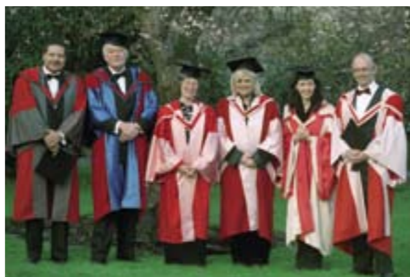
Buaiteoirí na Céime Onóraite i searmanais tosaithe an Gheimhridh, 2004.