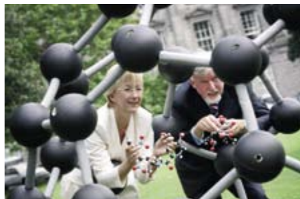
An tAire Oideachais agus Eolaíochta Mary Hanafin T.D., ag oscailt na Féile Eolaíochta BA.

Rinneadh athbhreithniú ar thrí cheann de rannóga seirbhíse an Choláiste le linn 2004/05: ba iad sin, an tSeirbhís Comhairleoireachta do Mhic Léinn, an tSeirbhís Gairmchomhairle agus an tSeirbhís do Mhic Léinn faoi Mhíchumas.