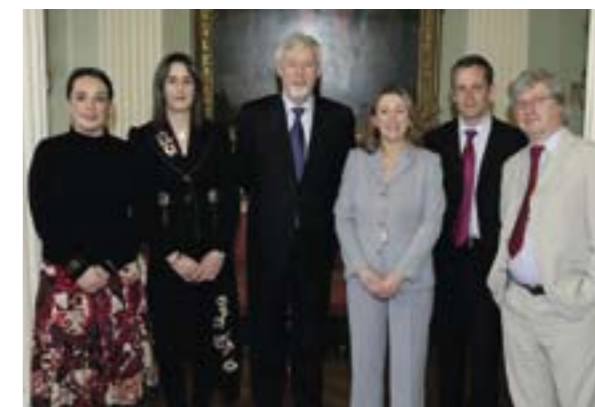
Buaiteoirí na ngradam in 2005.

Chuaigh trí Choláiste de chuid Choiste Gairmoideachais Chathair Bhaile Átha Cliath (CGCBÁC) i gcomhpháirtíocht le Coláiste na Tríonóide chun bunchúrsa maidir le rochtain ar raon leathan de chúrsaí fochéime a fhorbairt agus a chomhsheachadadh. Is iad na coláistí CGCBÁC atá bainteach ná Coláiste an Phiarsaigh, Coláiste Phluincéid agus Coláiste na Saoirsí. Reáchtáladh an cúrsa ar bhonn píolótach i 2004/5 agus idirbheartaigh na coláistí CGCBÁC, tacaíthe ag Coláiste na Tríonóide, go rathúil le Comhairle na nDámhachtainí Breisoideachais agus Oiliúna (CDBO) do chreidiúnú laistigh den Chreat Náisiúnta Cáilíochtaí. Chuaigh trí dhaltá déag ón scéim seo ar aghaidh go dtí cúrsaí fochéime i gColáiste na Tríonóide.