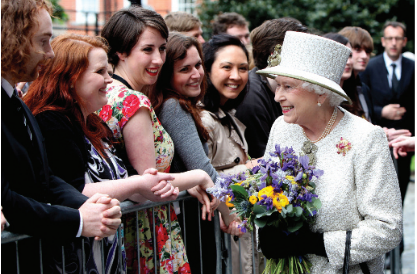
Casann a Soilse Banríon Eilís II le mic léinn an Choláiste

Bhí roinnt tionscnamh nua agus príomhimeachtaí sa Choláiste i rith na bliana acadúla 2010/11.