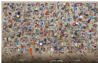
"Plaza nr 9" - Kacper Kowalski, Powiśki series

Od postkomunizmu po współpracę międzynarodową Polski, od nowej ery polskiego kina po najnowsze wydarzenia w polityce i ważne trendy społeczne i gospodarcze. Zajęcia są też okazją do dalszej pracy nad językiem akademickim i umiejętnościami krytycznej analizy tekstu: studenci przygotowują prezentacje na wybrany przez siebie temat i omawiają szczegółowo wybrane zagadnienie w ramach eseju pisanego na koniec każdego semestru.